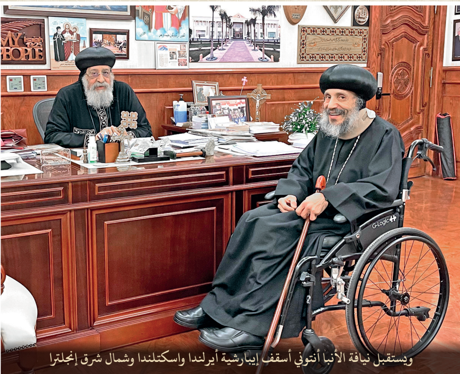
ودستقبل نيافة الأنبا أنتوني أسقف إيبارشية أيرلندا واسكتلندا وشمال شرق إنجلترا