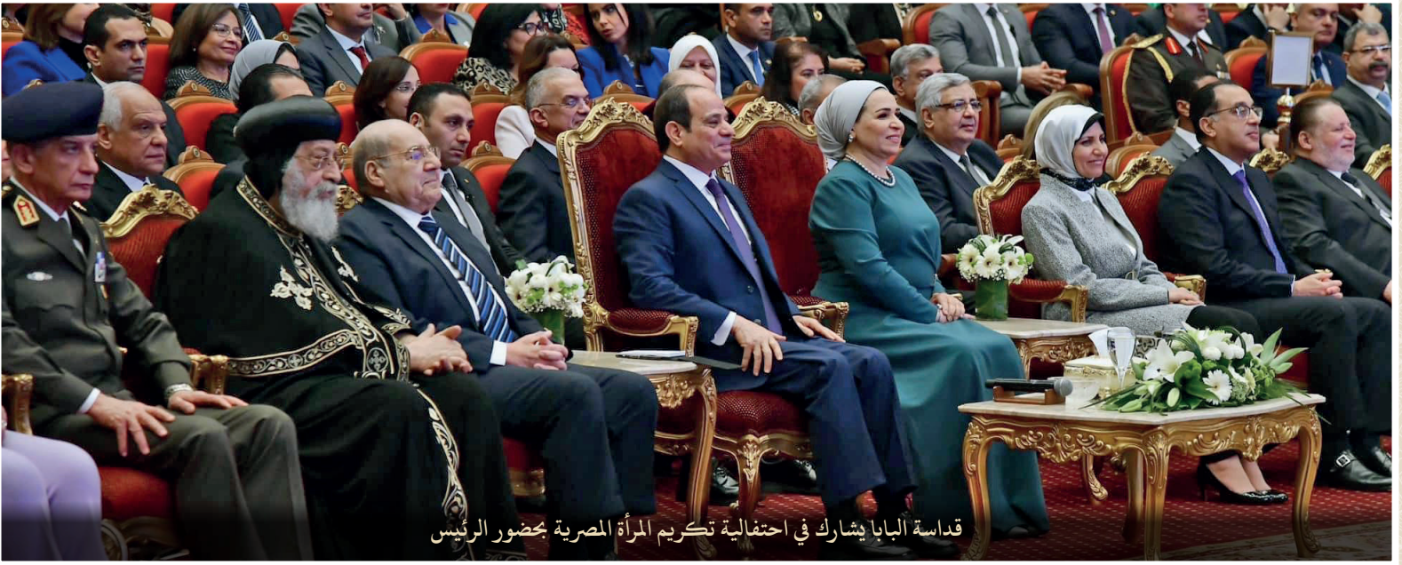
قداسة البابا يشارك في احتفالية تكريم المرأة المصرية بحضور الرئيس