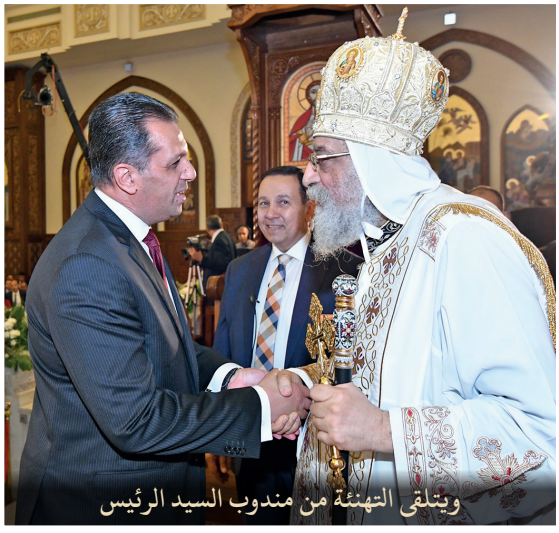
ويتلقى التهئة من مندوب السيد الرئيس