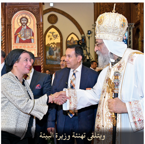
ويتلقى تهئة وزيرة البيئة