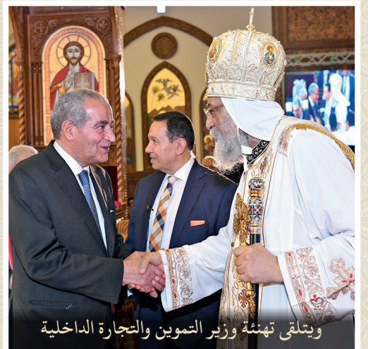
ويتلقى تهئة وزير التموين والتجارة الداخلية