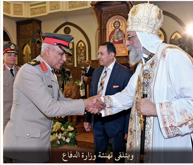
ويتلقى تهئة وزارة الدفاع