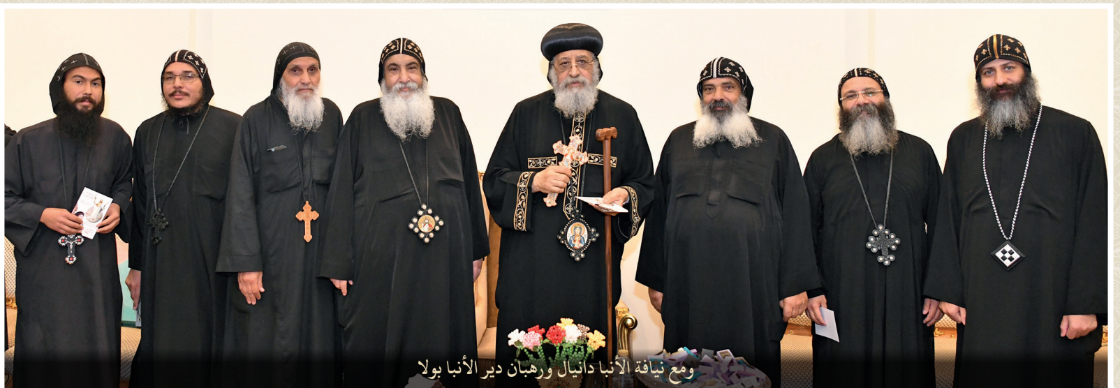
ومع نيافة الأنبا دانيال وراهبان دير الأنبا بولا