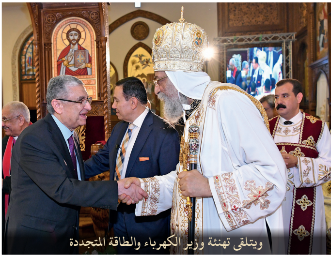
ويتلقى تهئة وزير الكهرباء والطاقة المتجددة