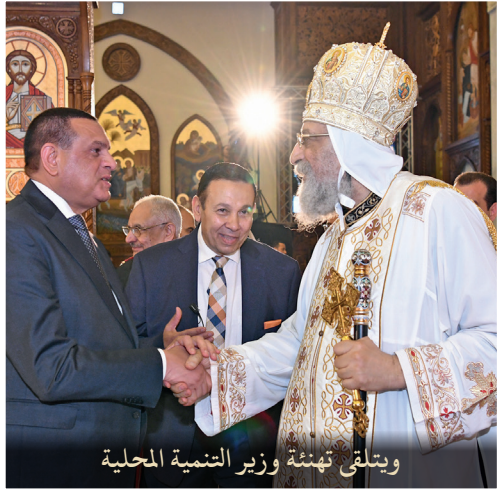
ويتلقى تهنئة وزير التنمية المحلية