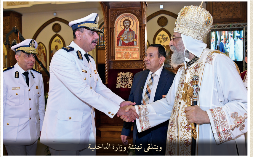
ويتلقى تهئة وزارة الداخلية