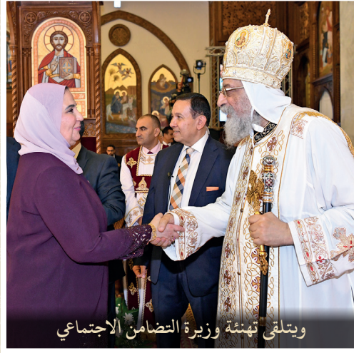
ويتلقى تهنئة وزيرة التضامن الاجتماعي