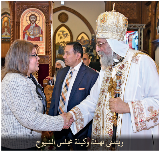
ويتلقى تهئة وكيلة مجلس الشيوخ