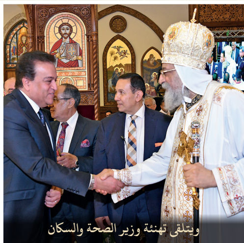
ويتلقى تهئة وزير الصحة والسكان