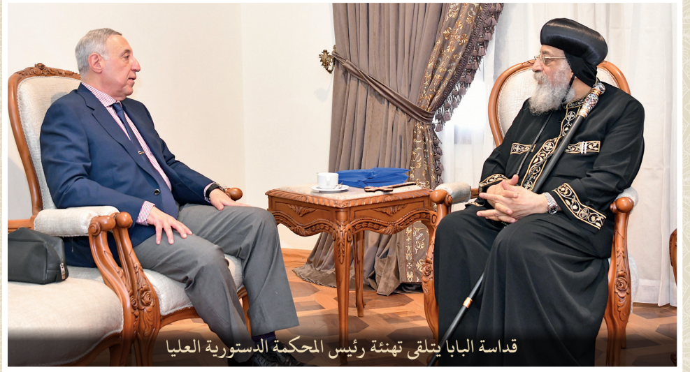
قداسة البابا يتلقى تهئة رئيس المحكمة الدستورية العليا