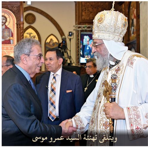
ويتلقى تهنئة السيد عمرو موسى