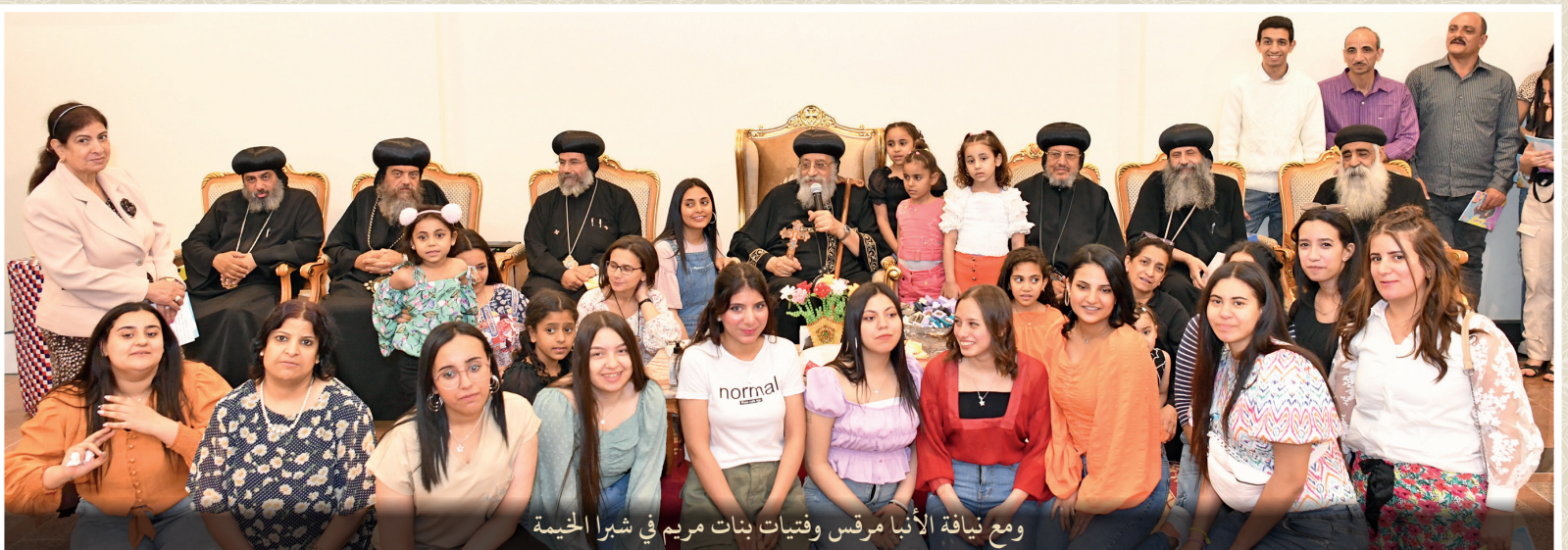
ومع نيافة الأنبا مرقس وفتيات بنات مريم في شبرا الخيمة