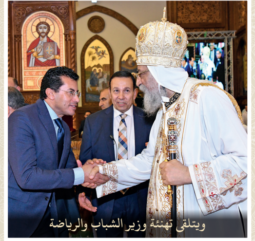
ويتلقى تهنئة وزير الشباب والرياضة