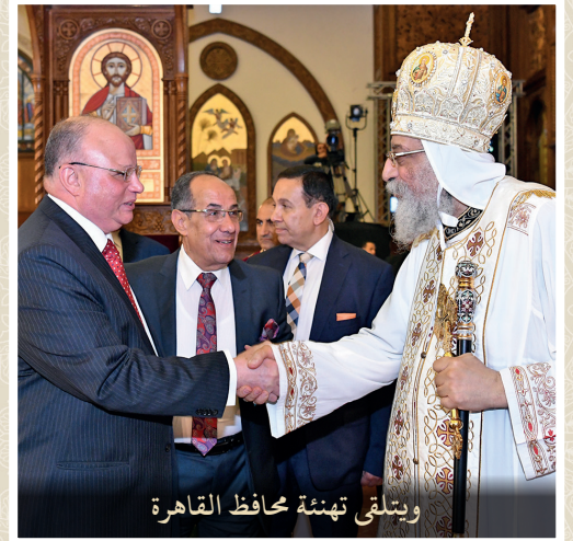
ويتلقى تهنئة محافظ القاهرة