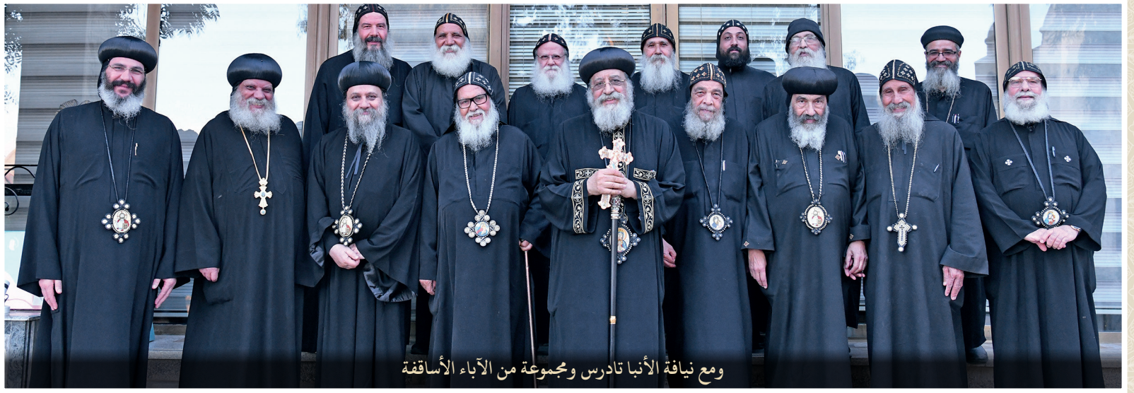
ومع نيافة الأنبا تادرس ومجموعة من الآباء الأساقفة