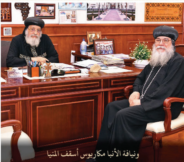
ونيافة الأنبا مكاروريوس أسقف المنيا