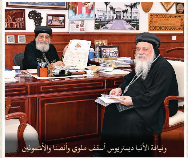
ونيافة الأنبا ديمتريوس أسقف ملوي وأنصنا والأشمونين