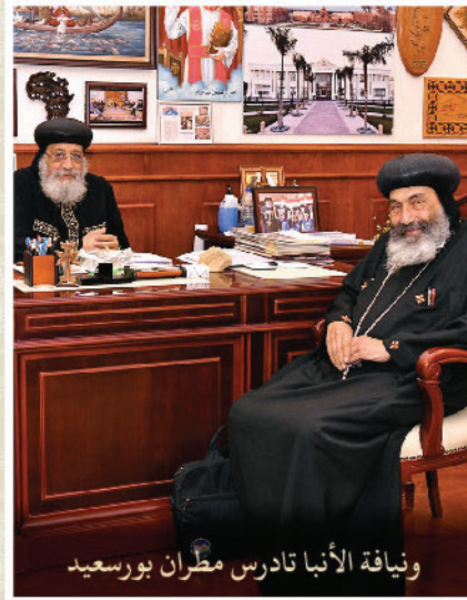
ونيافة الأنبا تادرس مطران بورسعيد