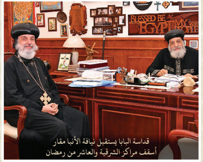
قداسة البابا يستقبل نيافة الأنبا مكار أسقف مراكز الشرقية والعاشر من رمضان