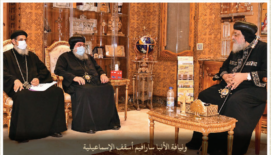
ونيافة الأنبا سارافيم أسقف الإسماعيلية