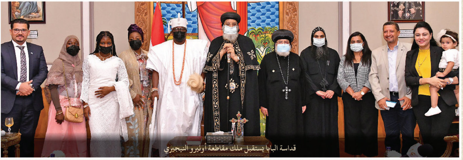
قداسة البابا يستقبل ملك مقاطعة أونيرو النيجيري