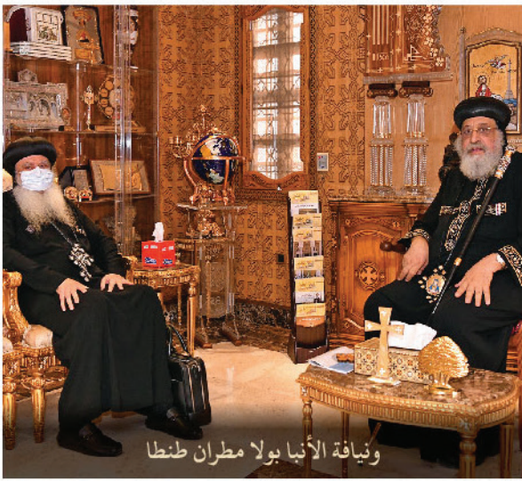
ونيافة الأنبا بولا مطران طنطا