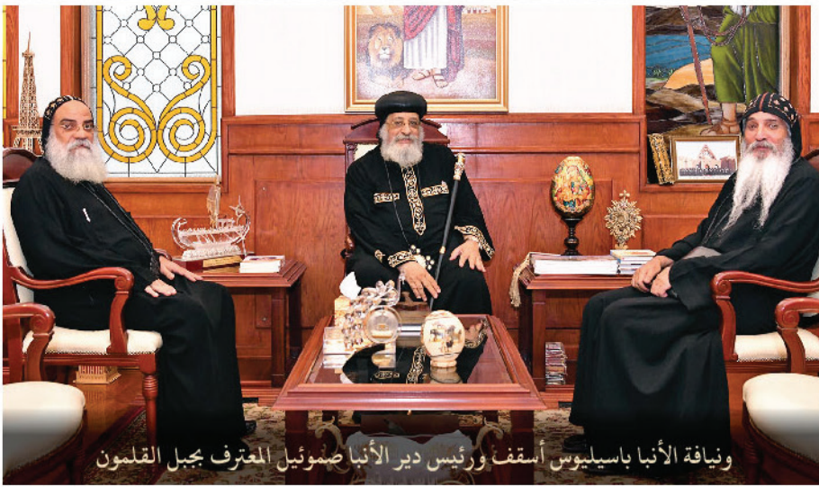
ونيافة الأنبا باسيلوس أسقف ورئيس دير الأنبا صموئيل المعترف بجبل القلمون