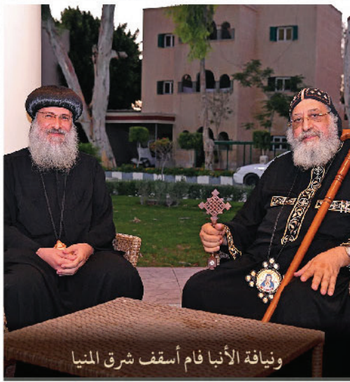
ونيافة الأنبا فام أسقف شرق المنيا