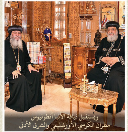
ويستقبل نيافة الأنبا انطونيوس مطران الكرسي الأورشليمي والشرق الأدنى