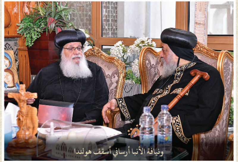
ونيافة الأنبا أرساني أسقف هولندا