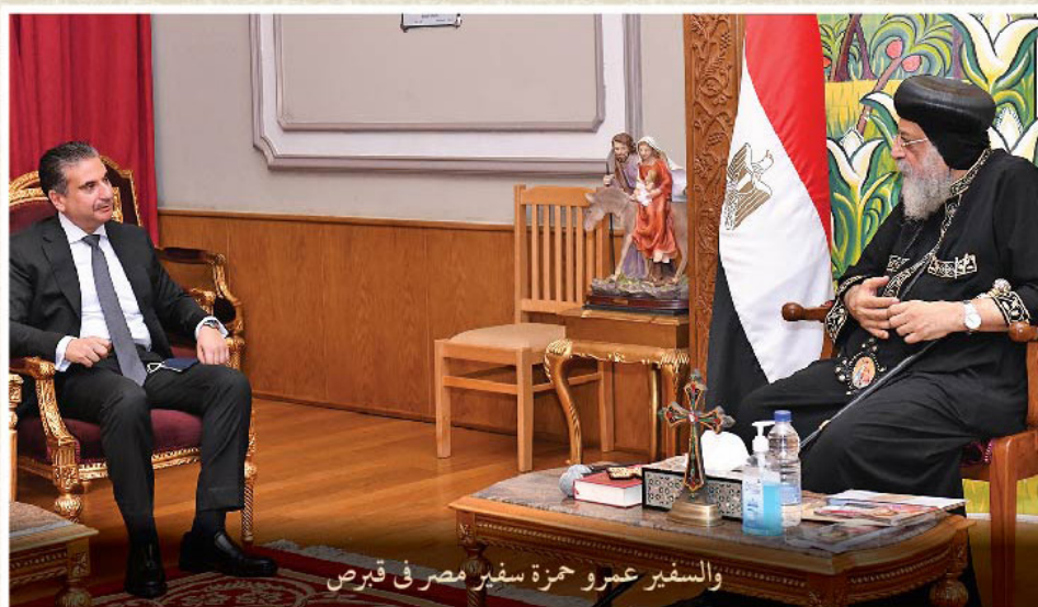
والسفير عمرو حمزة سفير مصر في قبرص