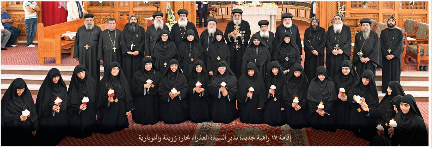
اقامة ١٧ راهبة جديدة بدير السيدة العذراء بحارة زويلة والنوبارية