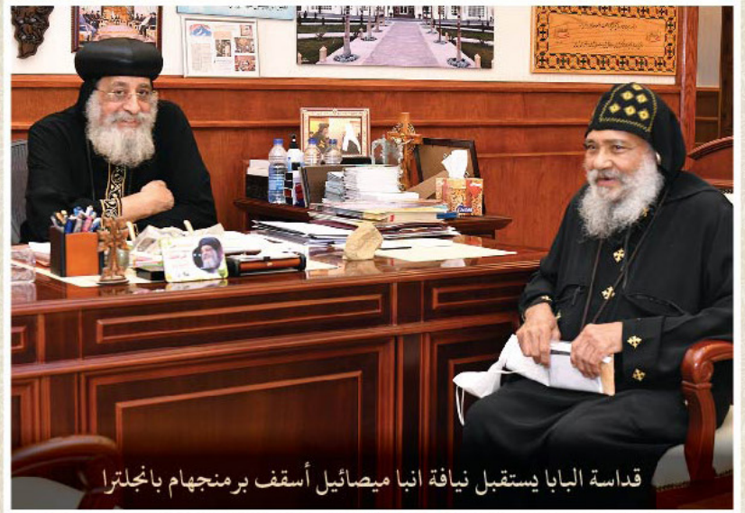
قداسة البابا إستقبال نيافة انبا ميصائيل أسقف برمنجهام بالجلترا