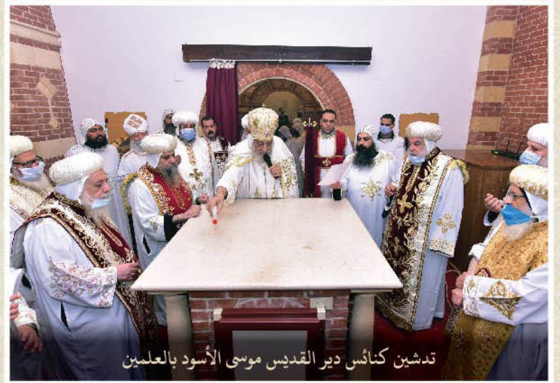
تدشين كنائس دير القديس موسى الأسود بالعلمين