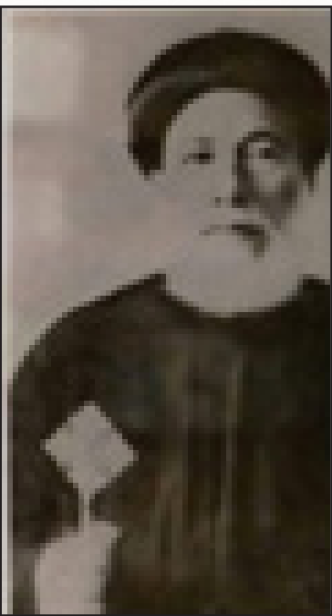
أنبا باخوميوس مطران النوبة وعطبرة وأمدرمان