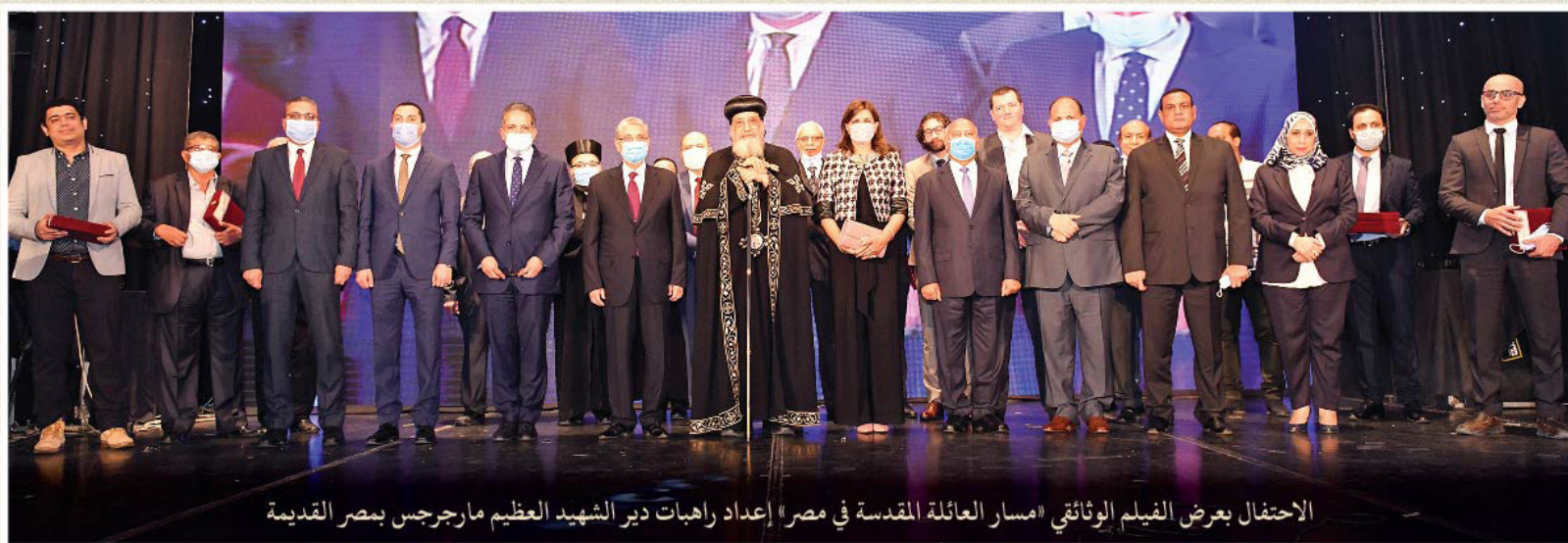
الاحتفال بعرض الفيلم الوثائقي «مسار العائلة المقدسة في مصر» إعداد راهبات دير الشهيد العظيم مار جرجس بمصر القديمة