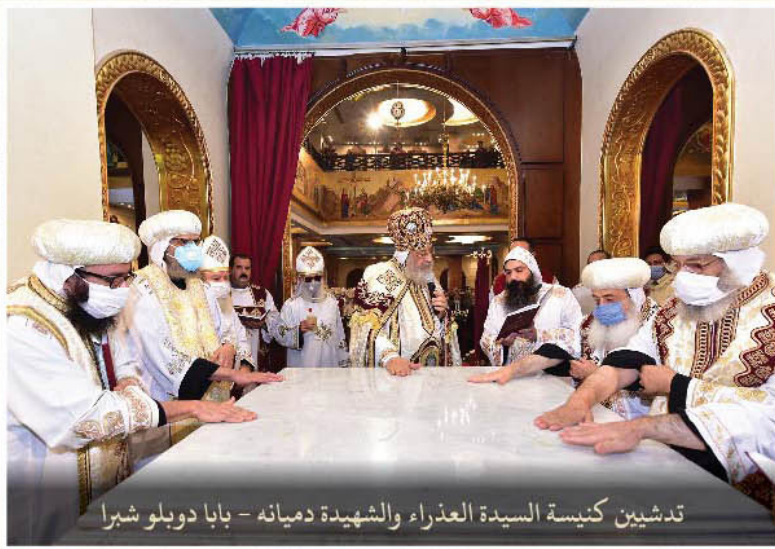
تدشين كنيسة السيدة العذراء والشهيدة دميانه - بابا دوبلو شبرا