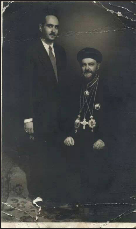
أنبا يونس مطران الخرطوم والجنوب وأوغنده

بفرنسا، بناءً على تركية المتيح أنبا غريغوريوس، تلك البعثة التي عاد منها حاصلاً على شهادة الدكتوراه في العلوم اللاهوتية سنة ١٩٦٣. ومنذ عودته من الخارج وحتى قارب الثمانين من عمره، كرّس حياته للخدمة والتدريس بالكلية الإكليزيكية بالقاهرة. وبعد صراع مع المرض رقد في الرب بشيخوخة صالحة في يوم ١٧ فبراير ٢٠٠٢.