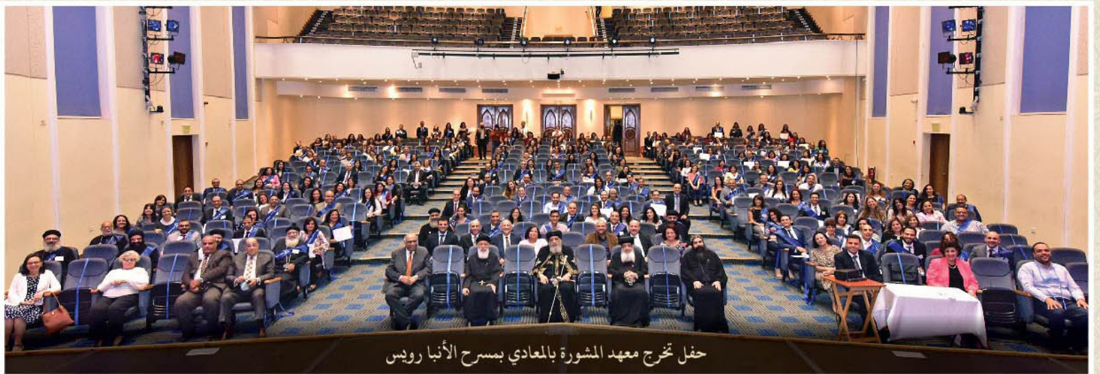
حفل تخرج معهد المشورة بالمعادي بسرح الأنبا رويس