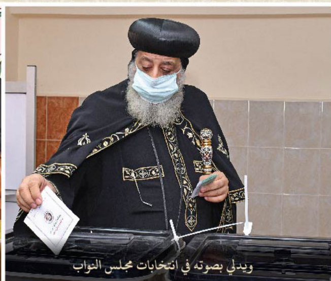
ويدي بصوته في انتخابات مجلس النواب