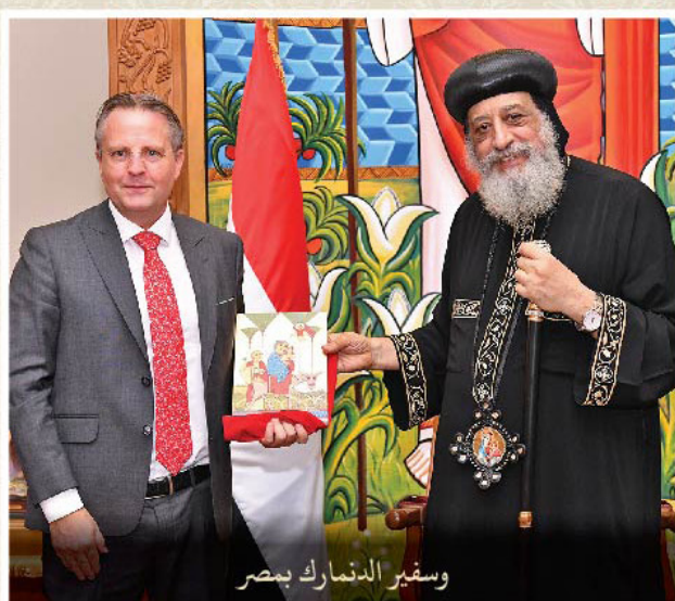
وسفير الدنمارك بمصر