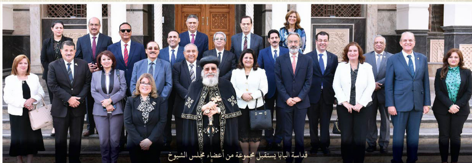
قداسة البابا يستقبل مجموعة من أعضاء مجلس الشيوخ