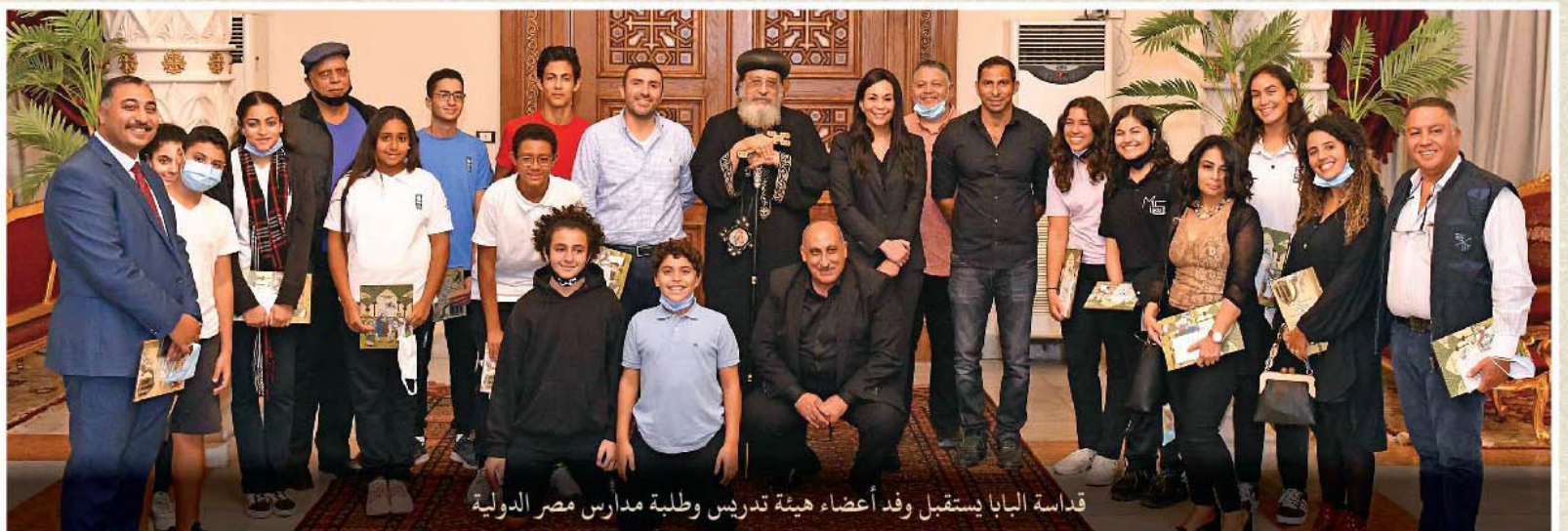
قداسة البابا يستقبل وفد أعضاء هيئة تدريس وطلبة مدارس مصر الدولية