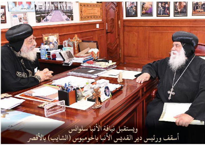
وإستقبال نيافة الأنبا سلوانس أسقف ورئيس دير القديس الأنبا باخوميوس (الشايب) بالأقصر