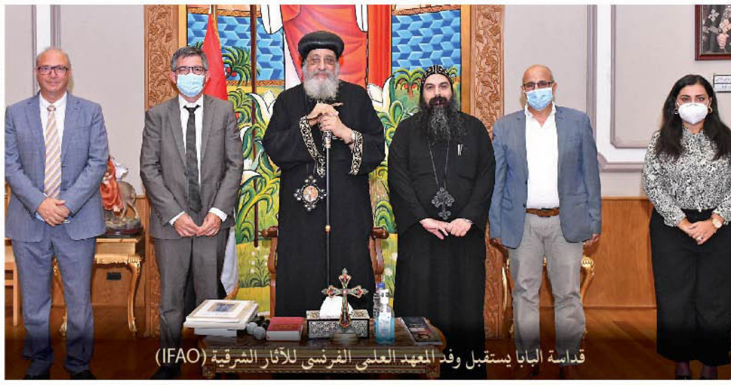
قداسة البابا يستقبل وفد المعهد العلمي الفرنسي للأثار الشرقية (IFAO)