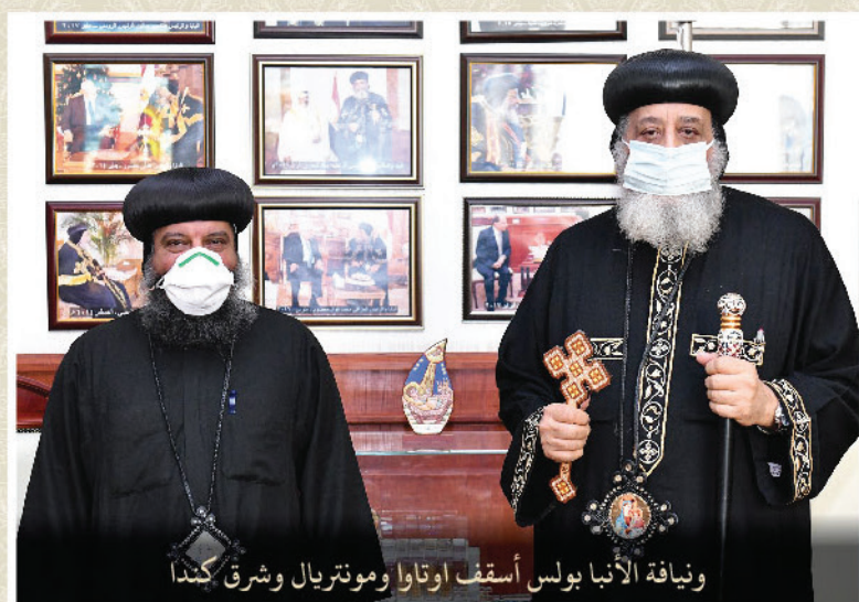
ونيافة الأنبا بولس أسقف اوتاوا ومونتريال وشرق كندا