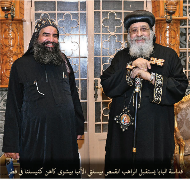
قداسة البابا يستقبل الراهب القمص بيسنتي الأبا يشوى كاهن كنيستنا في قطر