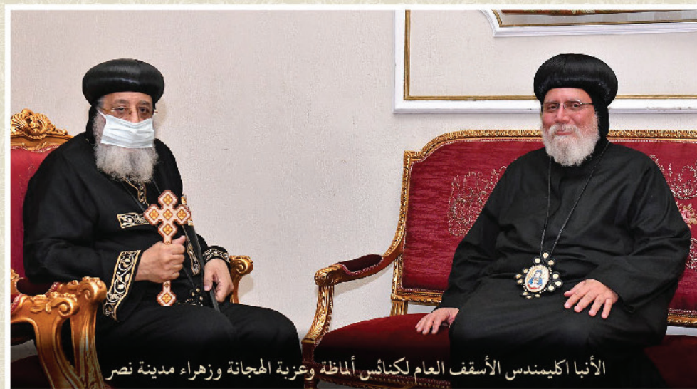
الأنبا اكليمنديس الأسقف العام لكنائس المازة وعزبة الهجانة وزهراء مدينة نصر