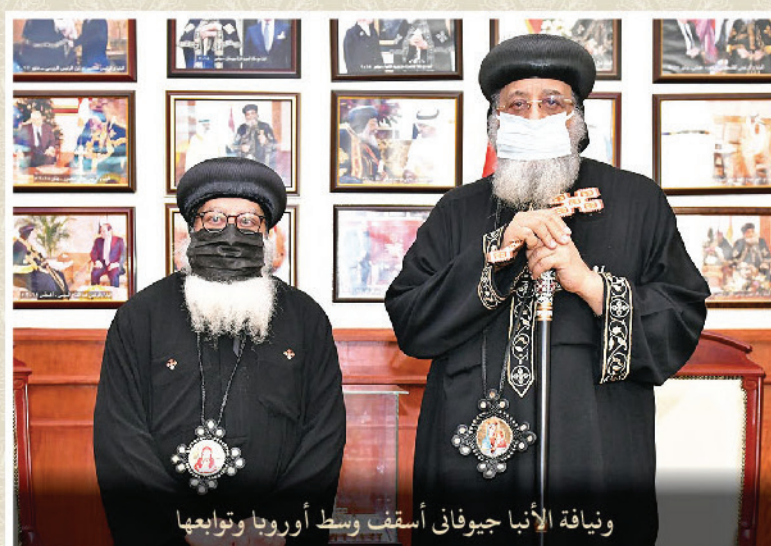
ونيافة الأنبا جيوفاني أسقف وسط أوروبا وتابعها