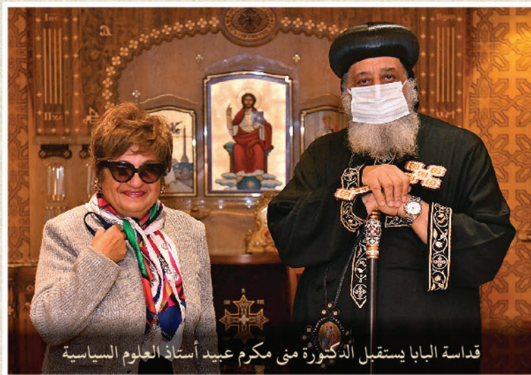
قداسة البابا يستقبل الدكتورة منى مكرم عبيد أستاذ العلوم السياسية