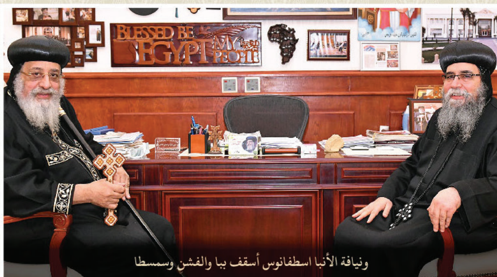
ونيافة الأنبا اسطفانوس أسقف ببا والقشن وسمسطا