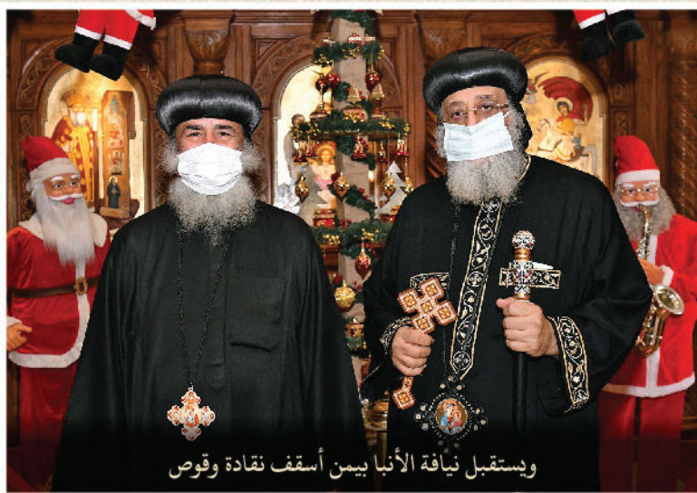
ويستقبل نيافة الأنبا ييمن أسقف نقادة وقوص