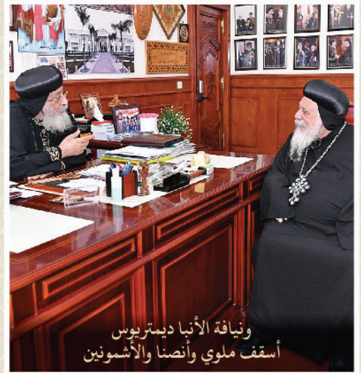
ونيافة الأنبا ديمتريوس أسقف ملوي وأنصنا والأشمونين