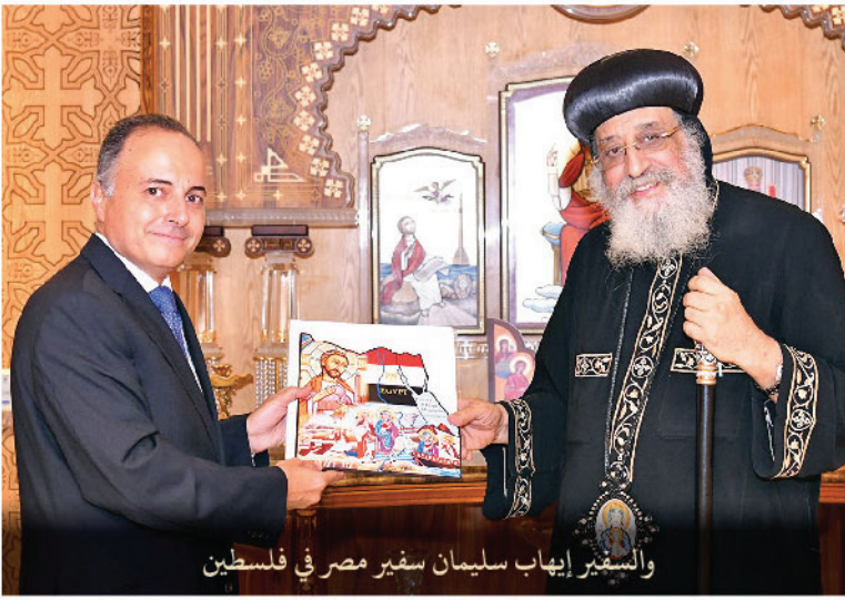
والمستقبل السفير إيهاب سليمان سفير مصر في فلسطين