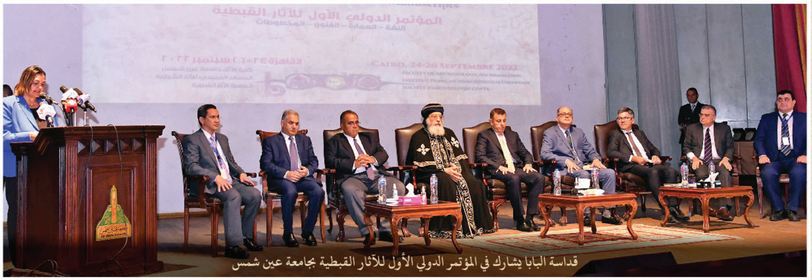
قداسة البابا يشارك في المؤتمر الدولي الأول للأثار القبطية بجامعة عين شمس