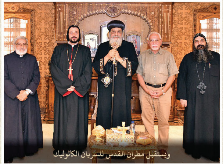
ويستقبل مطران القدس للسرمان الكاثوليك