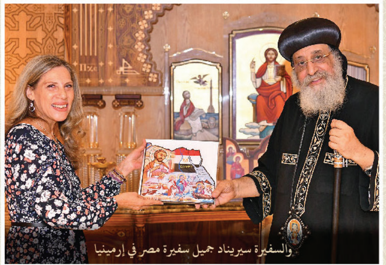
والمستقبل السفيرة سيريناد جميل سفيرة مصر في إرمينيا