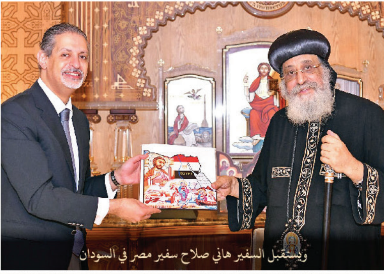
والمستقبل السفير هاني صلاح سفير مصر في السودان