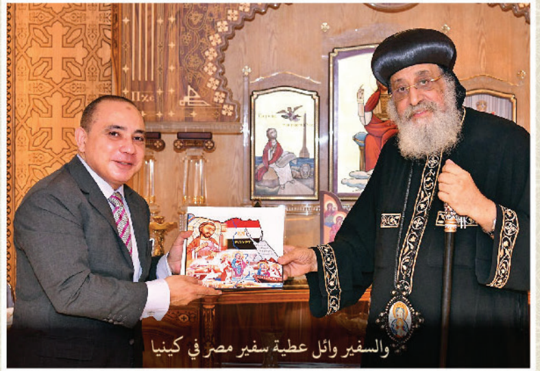
والمستقبل السفير وائل عطية سفير مصر في كينيا