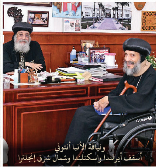
ونيافة الأنبا أنتوني أسقف أيرلندا واسكتلندا وشمال شرق إنجلترا