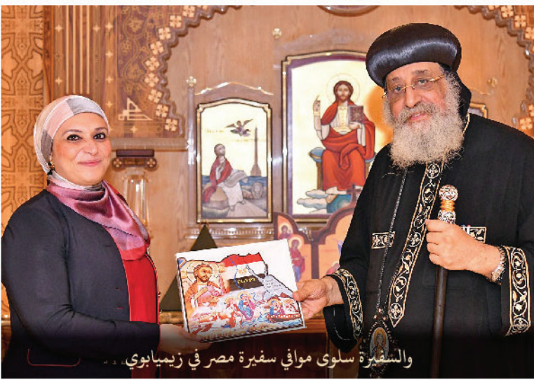
والمستقبل السفيرة سلوى مواني سفيرة مصر في زيمبابوي