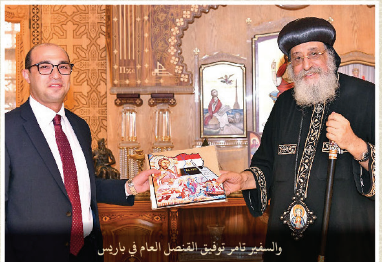
والمستقبل السفير تامر توفيق القنصل العام في باريس