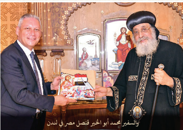
والمستقبل السفير محمد أبو الخير قنصل مصر في لندن