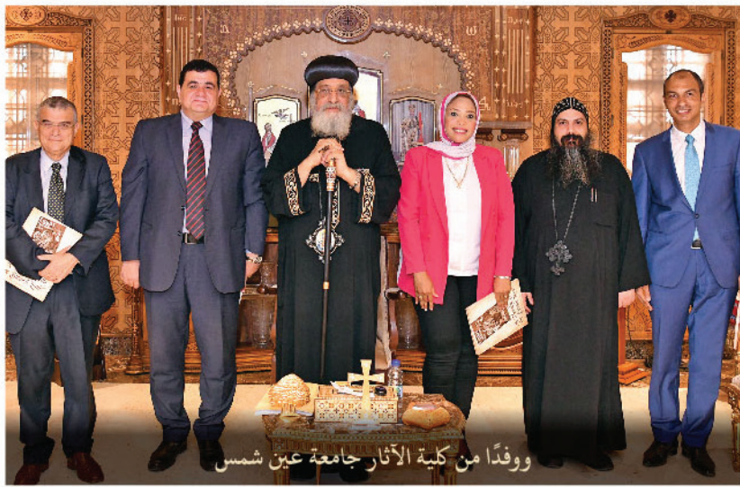
وفدًا من كلية الآثار جامعة عين شمس