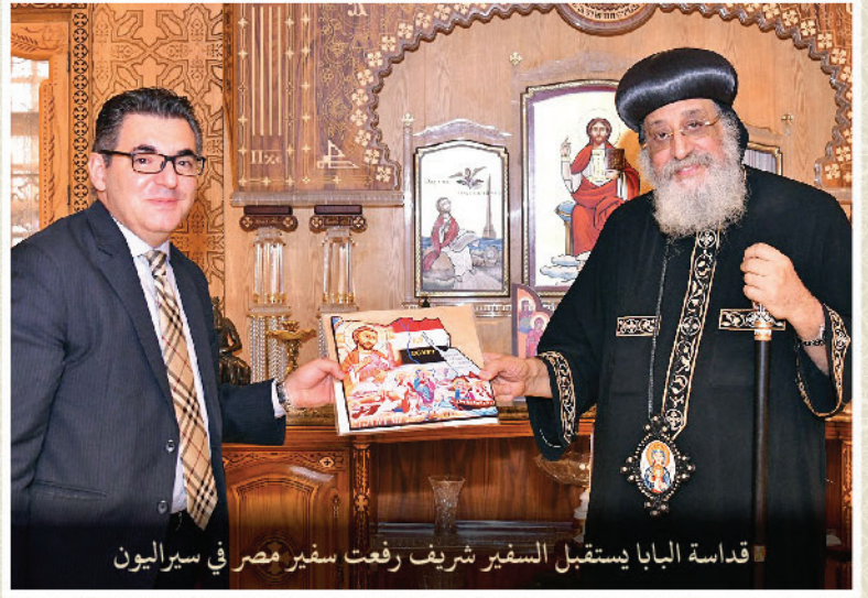
قداسة البابا يستقبل السفير شريف رفعت سفير مصر في سيراليون