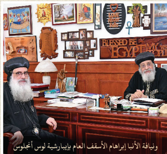
ونيافة الأنبا إبراهيم الأسقف العام بإيبارشية لوس أنجلوس